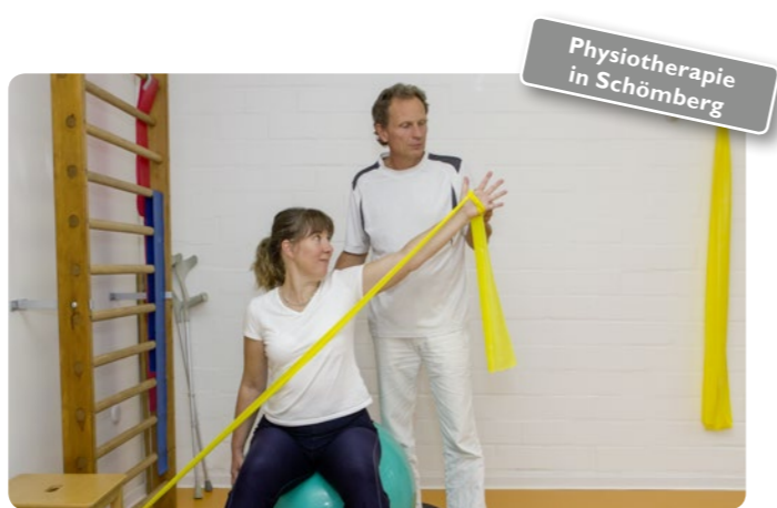
Physiotherapie in Schömburg

Als sie zur Reha-Vorbereitung anreiste, wurde sie von einigen Ängsten