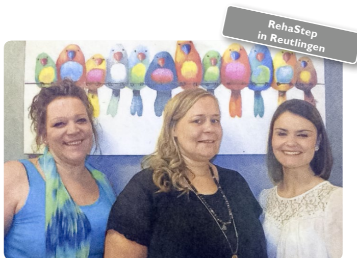
RehaStep in Reutlingen