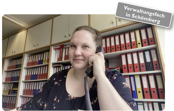
Verwaltungsfach in Schömburg

Die Praktikumsuche dagegen entpuppte sich wegen Covid-19