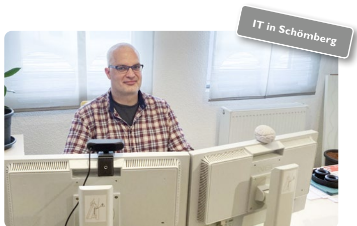
IT in Schömburg