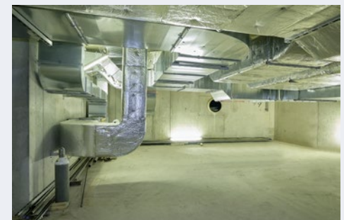
Eine mechanische Be- und Entlüftung sorgt für einen regelmäßigen Luftaustausch.