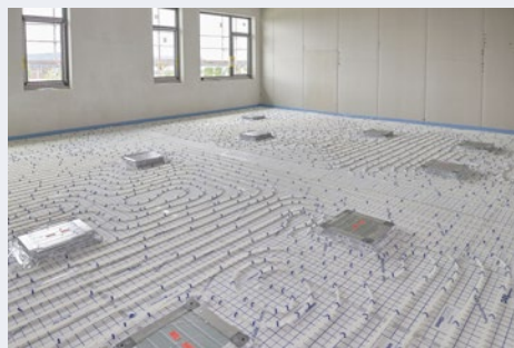
Ein modernes Eis-Energiespeichersystem liefert zu jeder Jahreszeit ein optimales Raumklima.