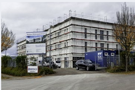
Auf 3.300 m 2 erwartet unsere Teilnehmenden ein durchdachtes Raumkonzept.

Der geplante Umzugstermin im April kann – aller Voraussicht nach – gehalten werden. Die Geschäftsstelle wird in den Osterferien 2021 (KW 14) nach Renningen umziehen.